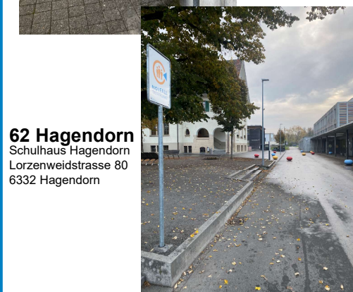
62 Hagendorn Schulhaus Hagendorn Lorzenweidstrasse 80 6332 Hagendorn